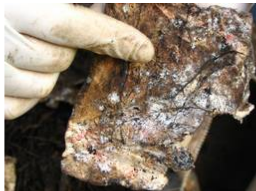
31.10.08 – nach 59 Tagen