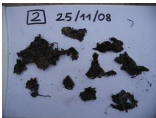
25.11.08 – nach 84 Tagen