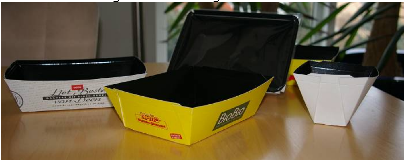
Abbildung – diverse Kundenhandmuster

MaWe-Pack - Foodpackaging with Style - Kaisersrain 12, DE-72581 Dettingen