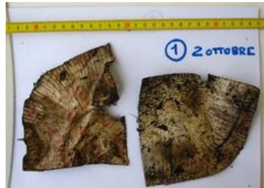
02.10.08 – nach 30 Tagen