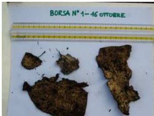
16.10.08 – nach 44 Tagen