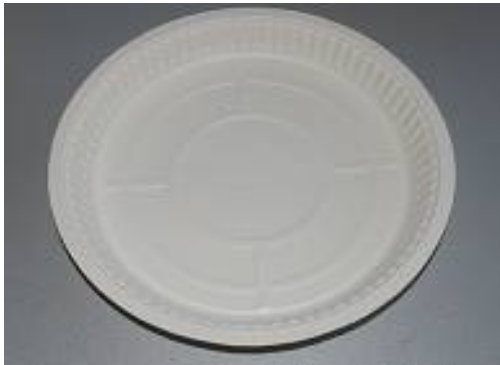
02.09.2008 – Start des Versuchs

Gem. UNI-EN 13432:2002 NORMEN - Ausgestellt von CONSORZIO ITALIANO COMPOSTATORI